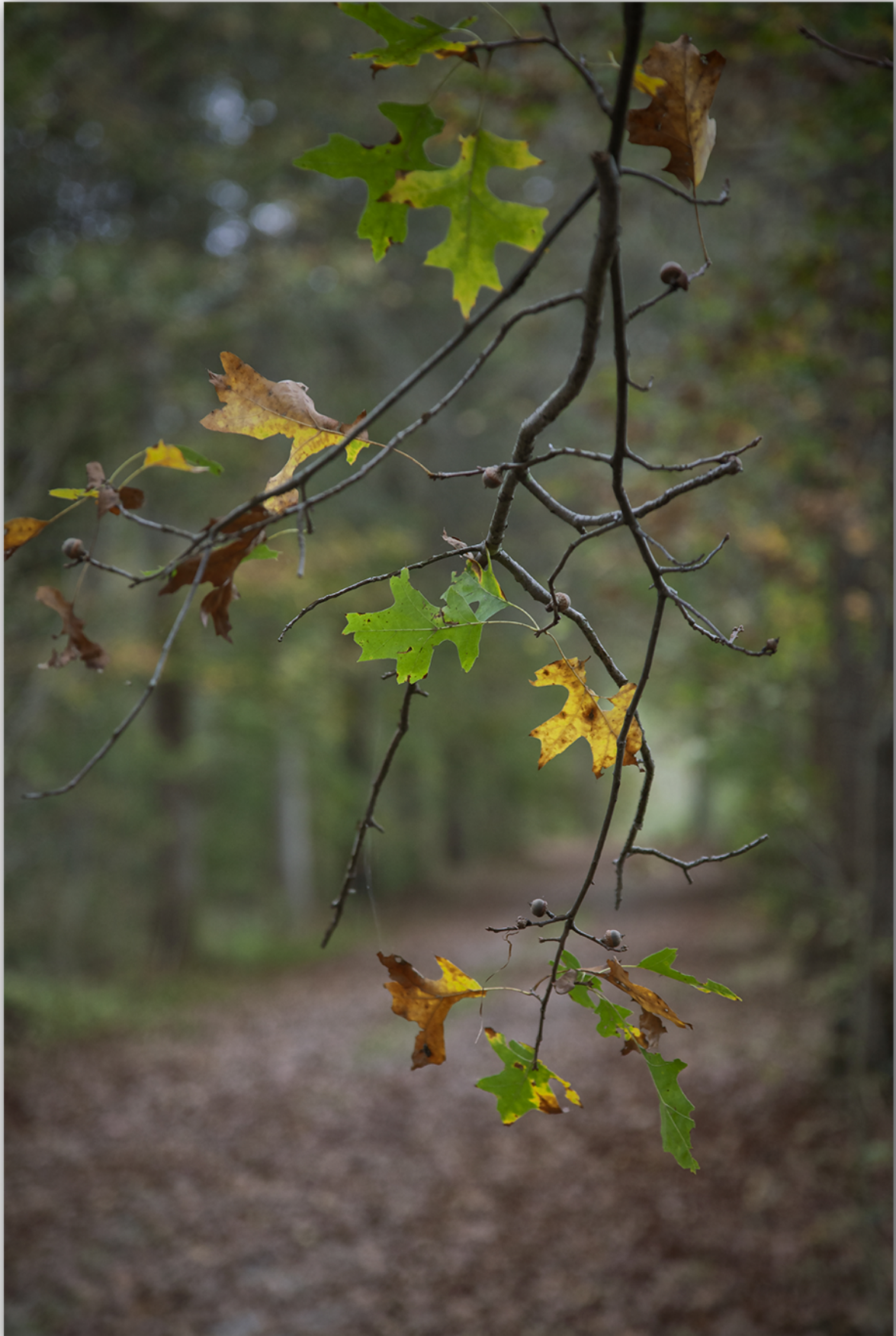
Autunno al Casone