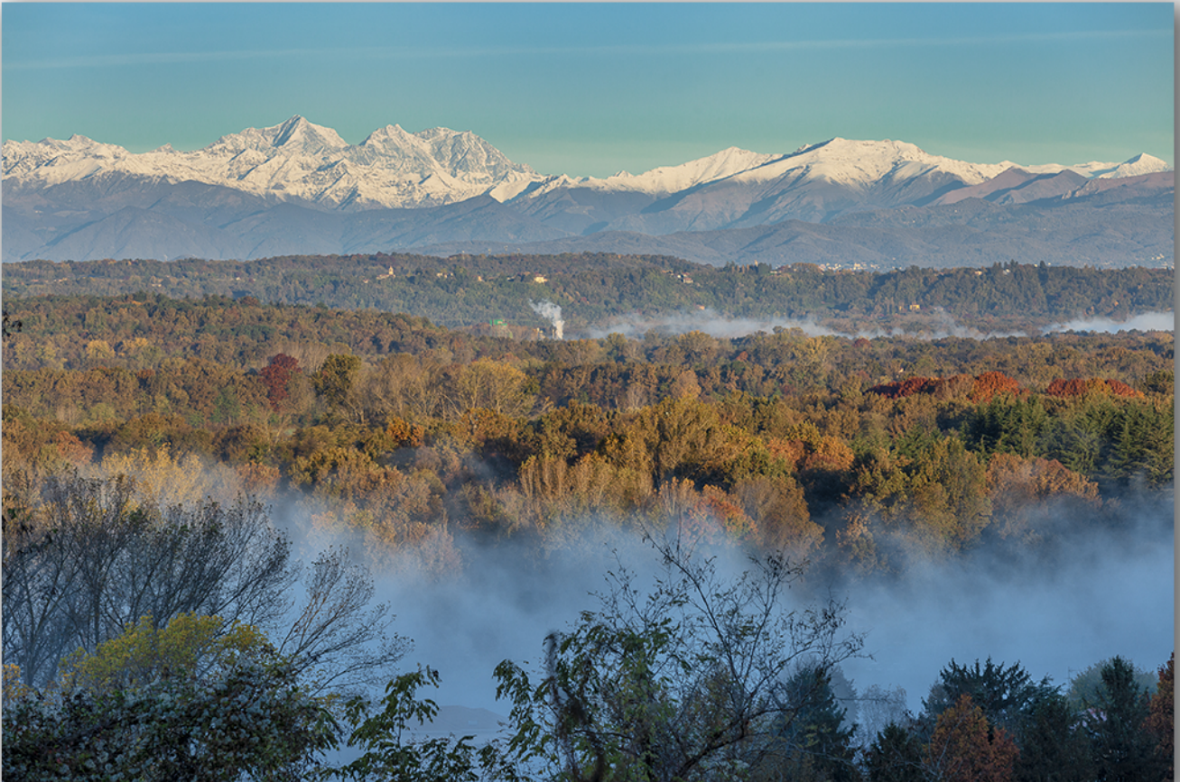
Valle del Ticino