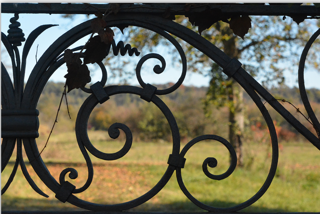
Decorazioni al Casone