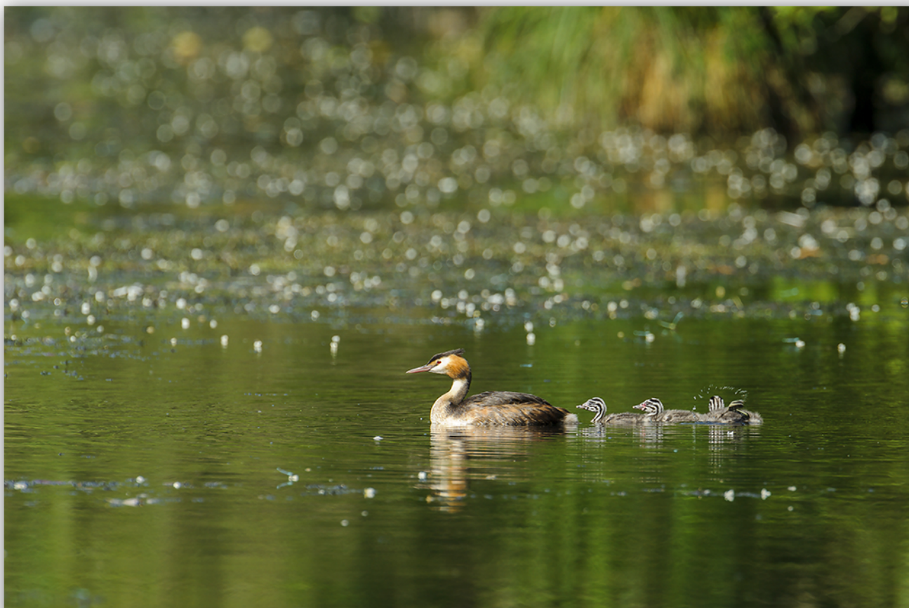
Svassi nella lanca del Ticino di Cameri