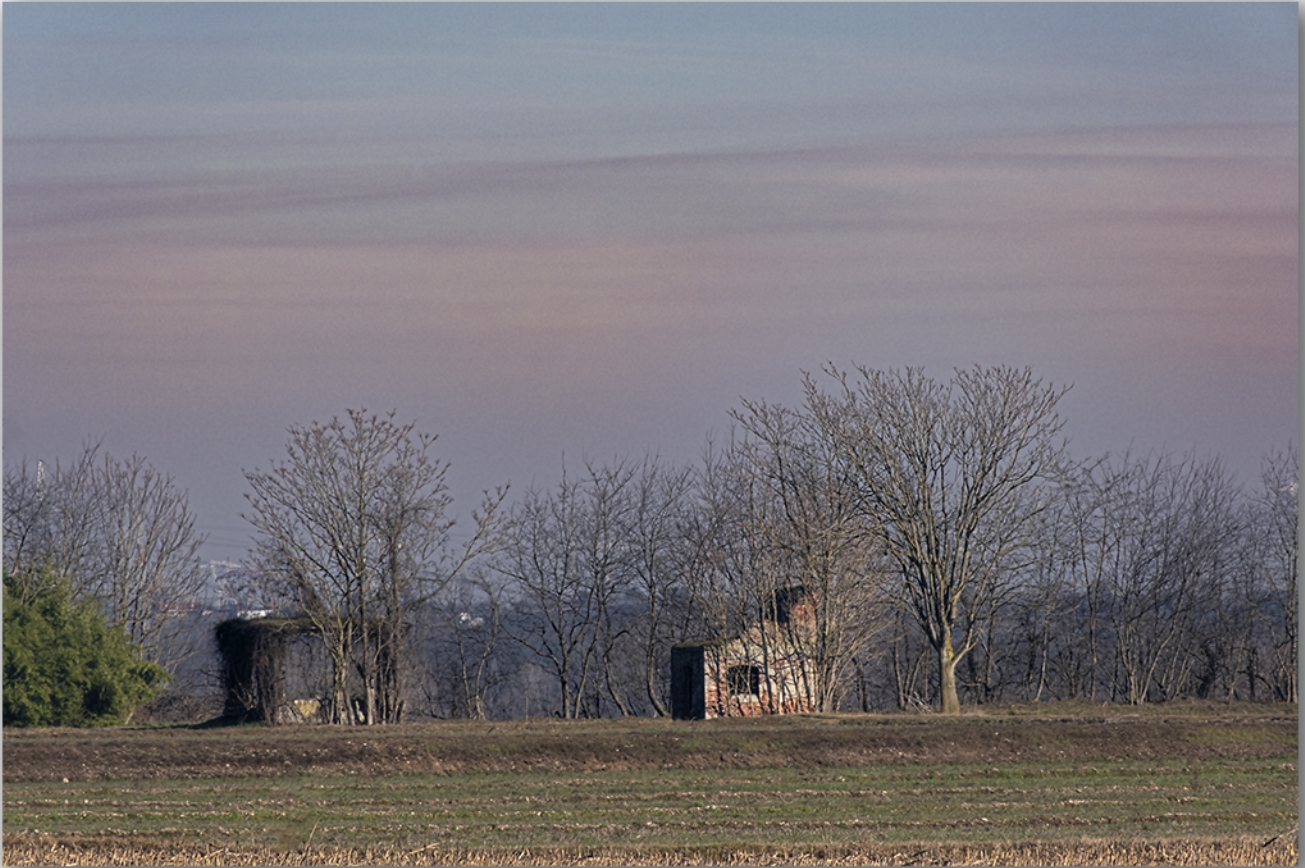
Località Villa Picchetta