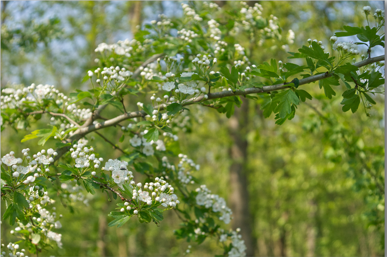
Primavera al Parco, Galliate