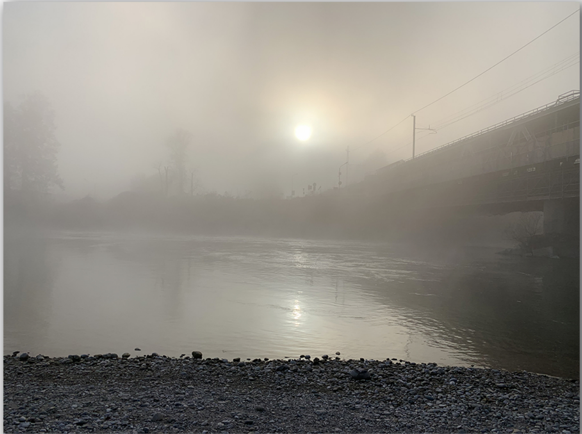
Foschia nel Parco