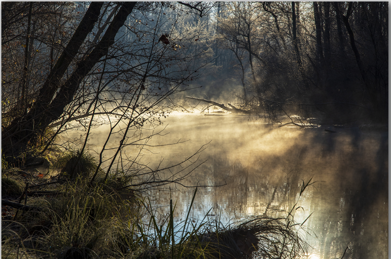
Lanca del Ticino, Cameri