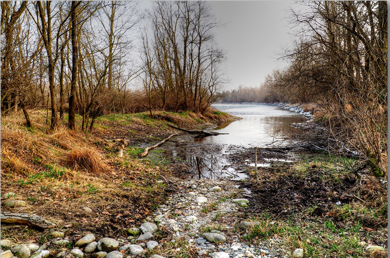
Lanca del Ticino