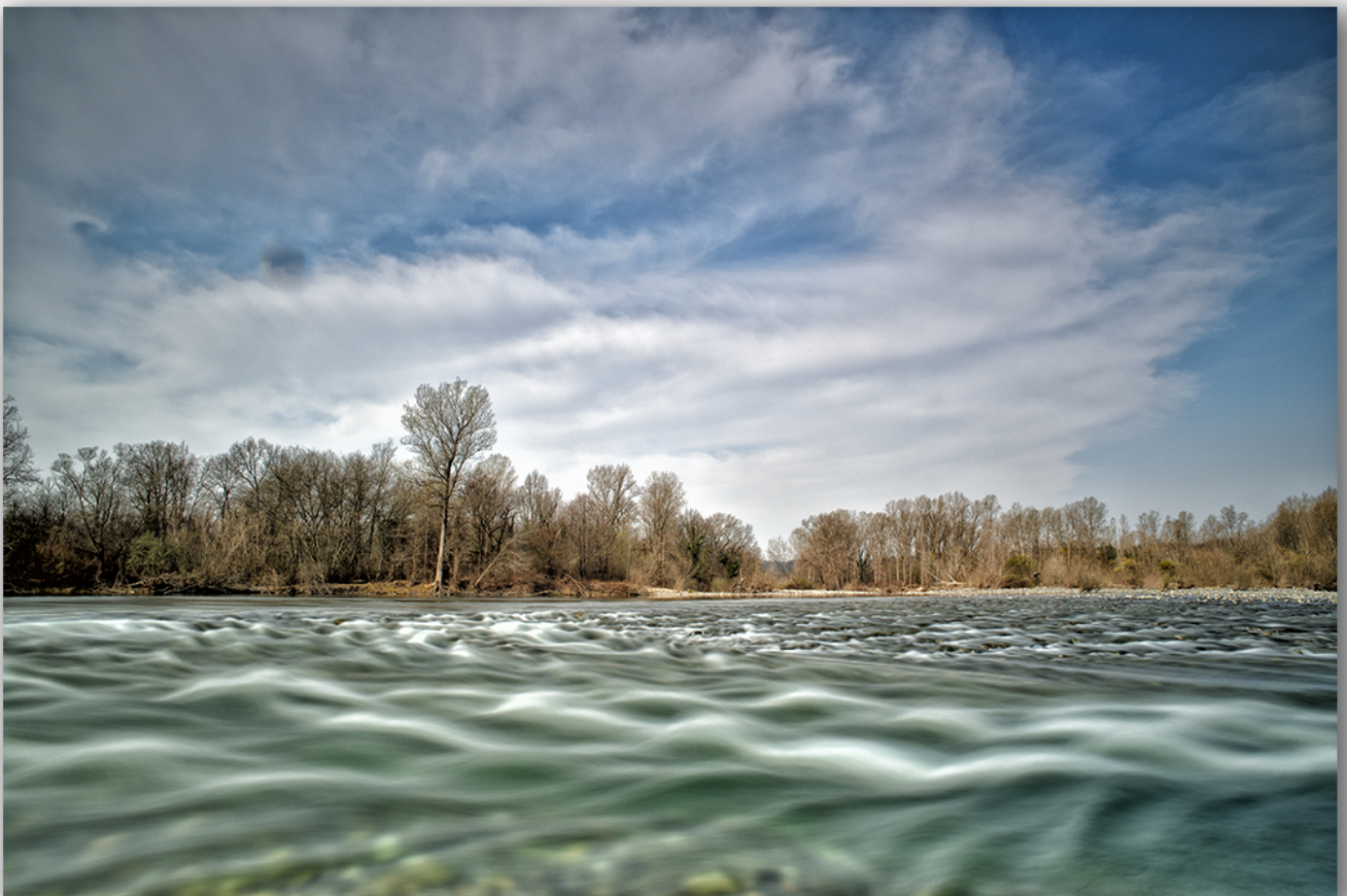
Ticino - Giochi d'acqua

Il progetto fotografico intende offrire un inedito punto di vista sull'area naturale protetta del Parco del Ticino fortemente caratterizzato dal fiume e dalla sua valle, un ecosistema di grande rilievo e bellezza nella sua unicità. L'immagine fotografica vuole valorizzare un ambiente dove l'uomo e la natura possono convivere in armonia.