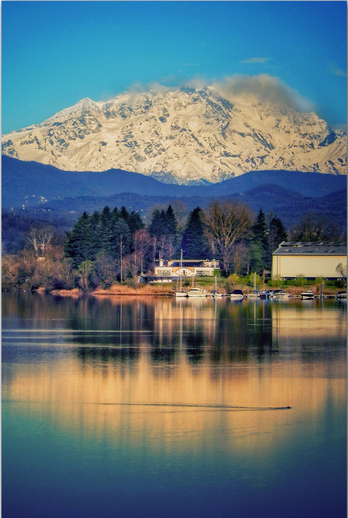
Ticino, specchio del Monte Rosa