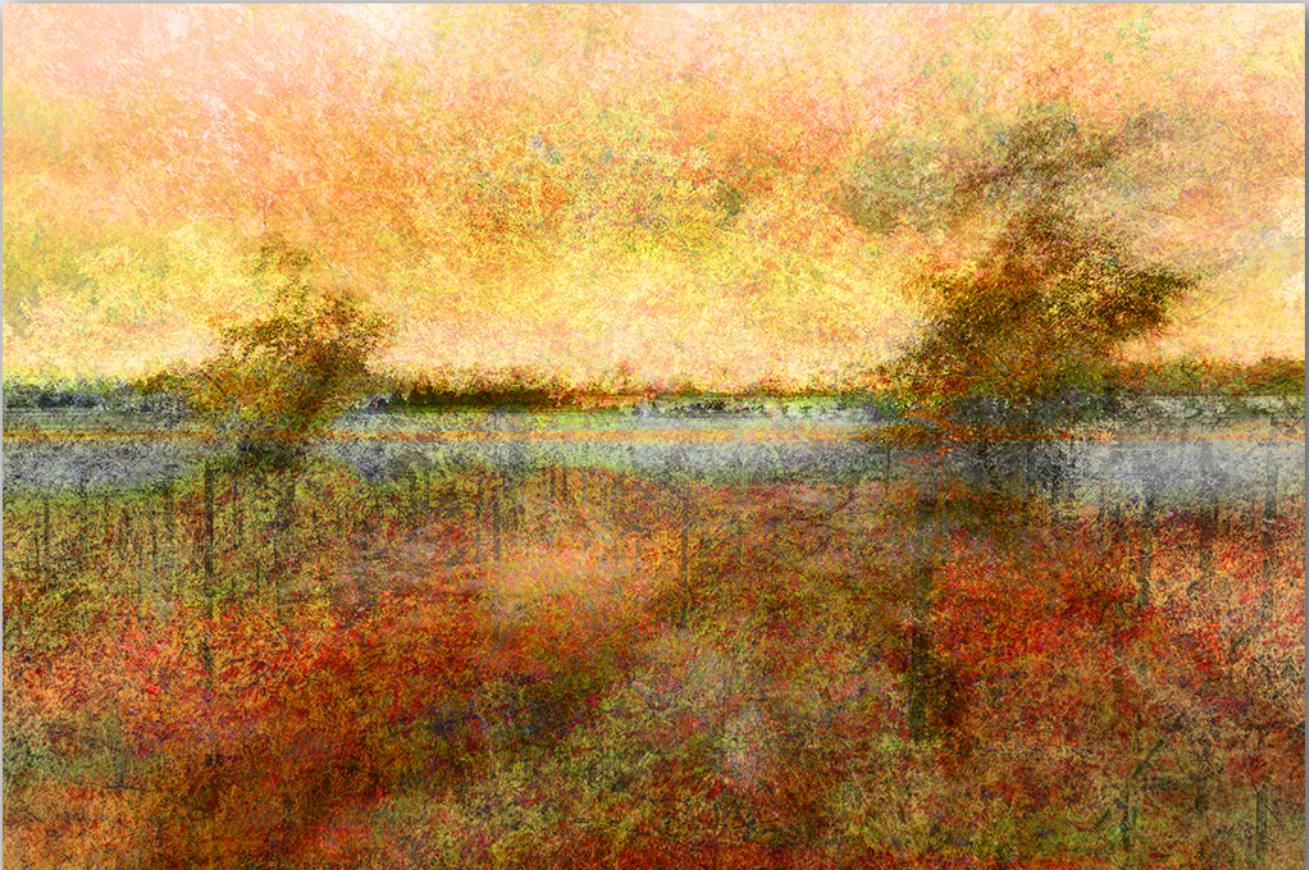
Ticino, vecchio fiume