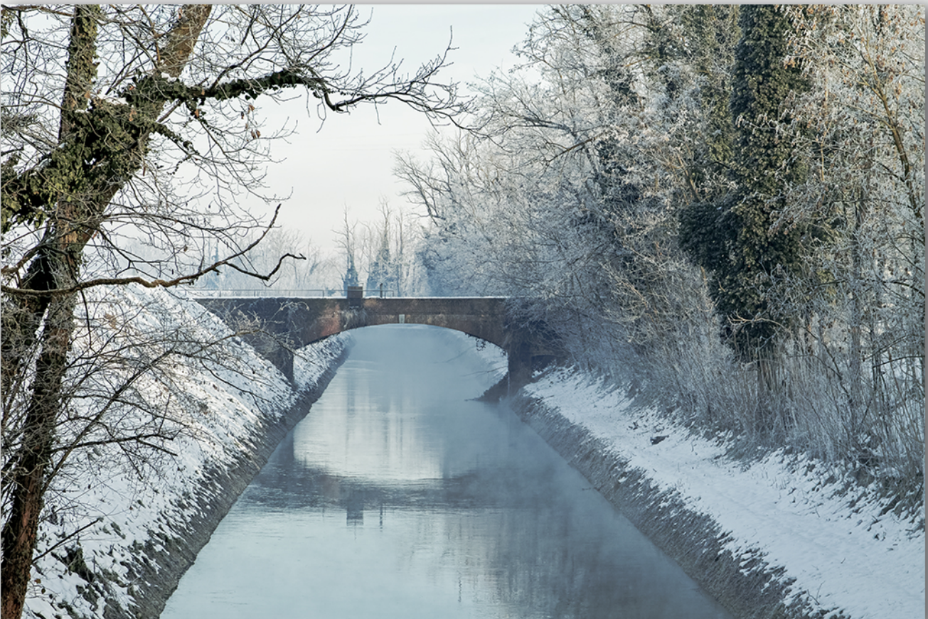
Cerano, Naviglio Langosco